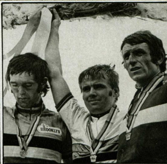
Drie belangrijke overwinningen uit de loopbaan van Hennie Kuiper : in 1972 wordt hij Olympisch kampioen in München (links onderaan), in 1975 wereldkampioen in Yvoir (hierboven op het podium tussen de ontgoochelde Roger De Vlaeminck en Jean-Pierre Danguillaume) en tien jaar later pakt hij de zege in Milaan-Sanremo